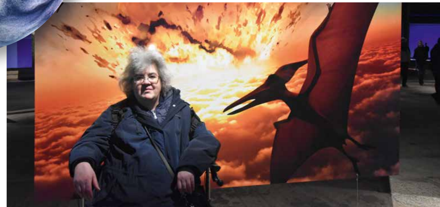
Fotos: Britta Marenbach, Teile der Ausstellung „Das zerbrechliche Paradies“: © Gasometer Oberhausen GmbH

Anschließend fuhren wir wieder runter und wir setzten uns noch was unten hin und tranken Kaffee. Wir wollten im Anschluss bei unserem Bus den leckeren Kartoffelsalat und die Würstchen essen wegen dem Wetter. Wir überlegten ob wir auf einer Raststätte essen sollten, aber es fing an zu regnen und darum entschlossen wir uns bis zur Tagesstätte durchzufahren und dort zu essen. Das war dann zwar ein sehr spätes Mittagessen, aber das machte nix. Es war auf jeden Fall sehr lecker und ein guter Abschluss eines schönen Tages. (bm)