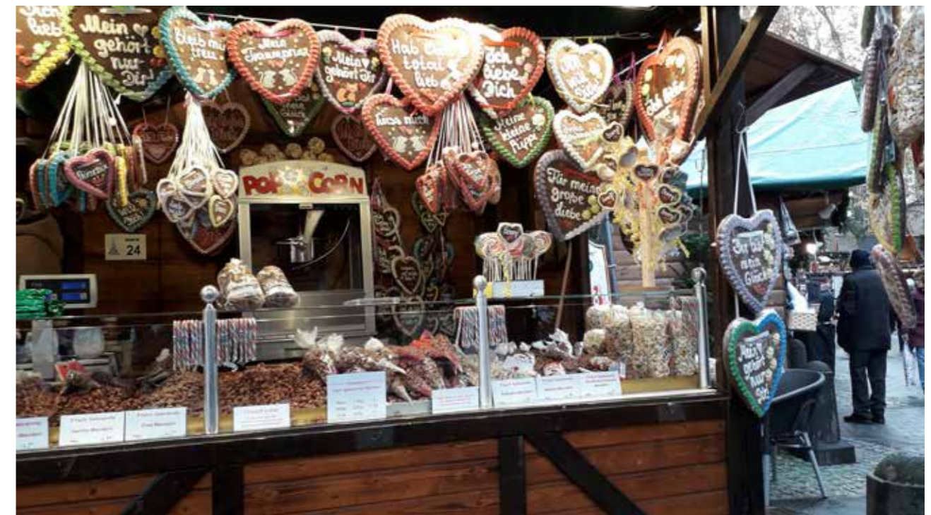
Das Magazin des Sozialpsychiatrischen Zentrums Eitorf/Siebengebirge